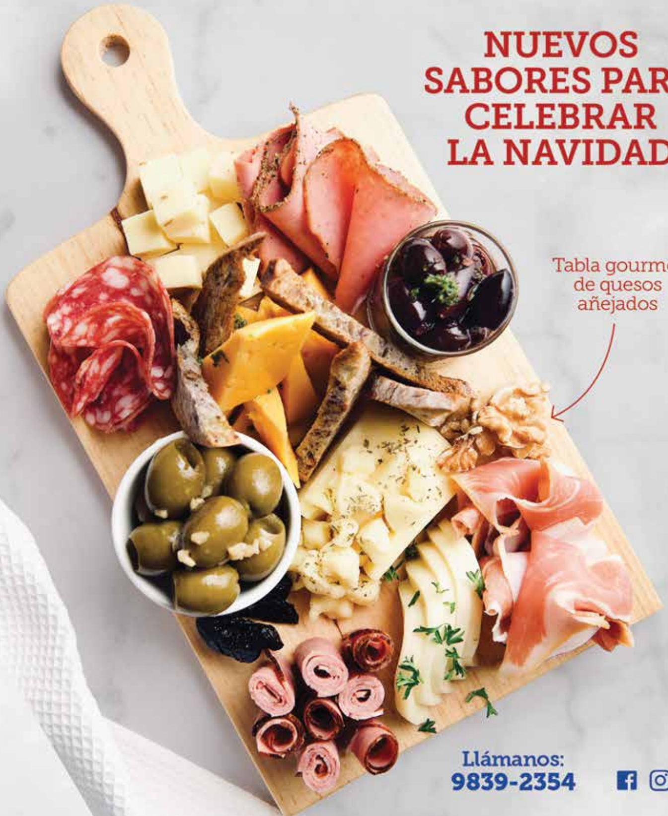
Tabla gourmet de quesos añejados